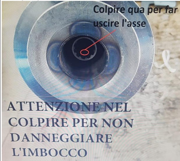
3 Colpire per fare uscire l'asse