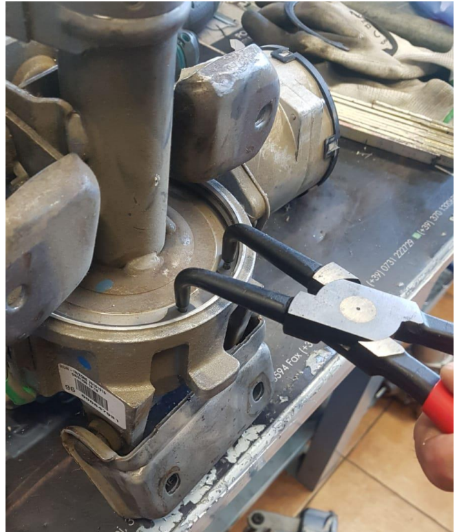
2 Estrarre la fascetta